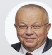
MUDr. Jiří Mašek předseda Výboru pro zdravotnictví, Poslanecká sněmovna Parlamentu České republiky