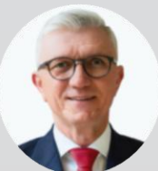
Mgr. Zdeněk Zajíček prezident, Hospodářská komora České republiky